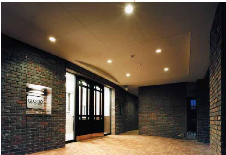
エントランス(昼景)