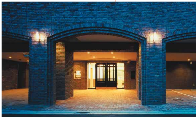
エントランス(夜景)